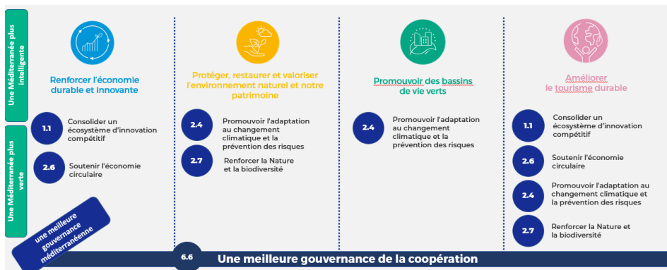
Illustration de la structure du Programme et des types de projets : priorités, objectifs spécifiques et missions

Tous les projets thématiques opérant sous chaque mission sont soutenus par un projet de communauté thématique et un projet de dialogue institutionnel.