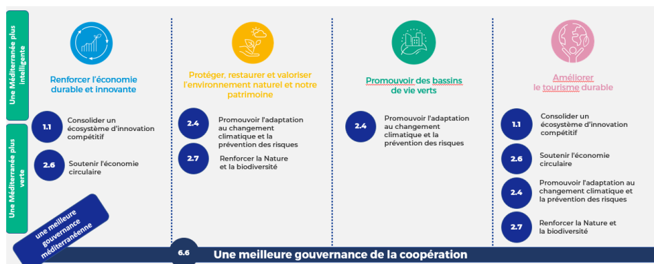
Illustration de la structure du Programme et des types de projets : priorités, objectifs spécifiques et missions

Tous les projets thématiques opérant sous chaque mission sont soutenus par un projet de communauté thématique et un projet de dialogue institutionnel.