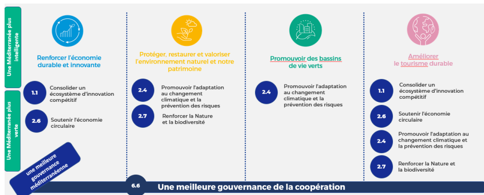
Illustration de la structure du Programme et des types de projets : priorités, objectifs spécifiques et missions

Tous les projets thématiques opérant sous chaque mission sont soutenus par un projet de communauté thématique et un projet de dialogue institutionnel.