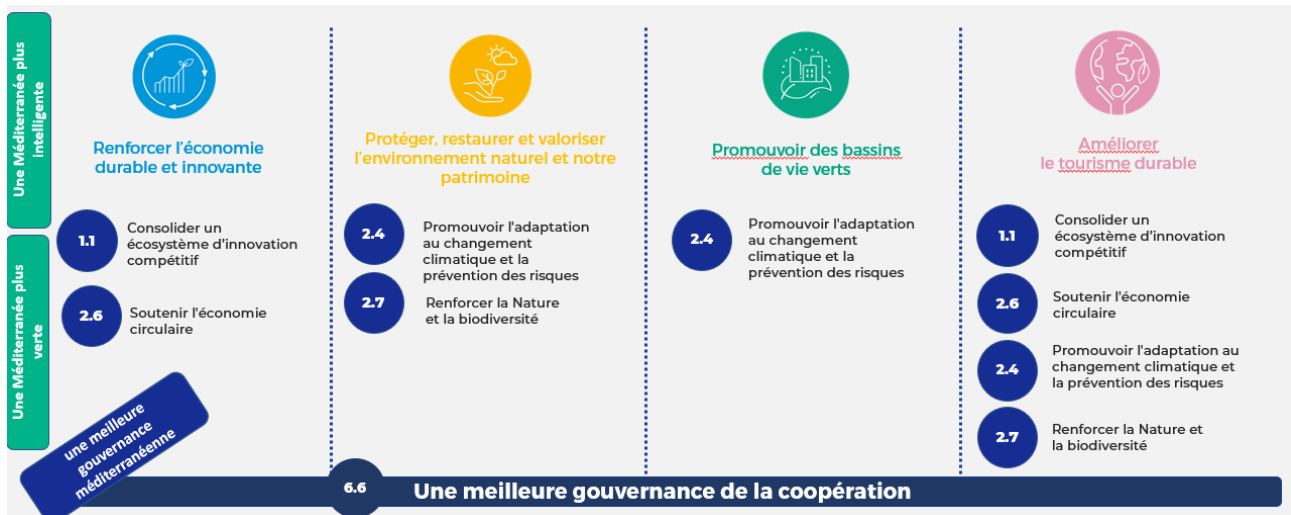
Illustration de la structure du Programme et des types de projets : priorités, objectifs spécifiques et missions

Tous les projets thématiques opérant sous chaque mission sont soutenus par un projet de communauté thématique et un projet de dialogue institutionnel.