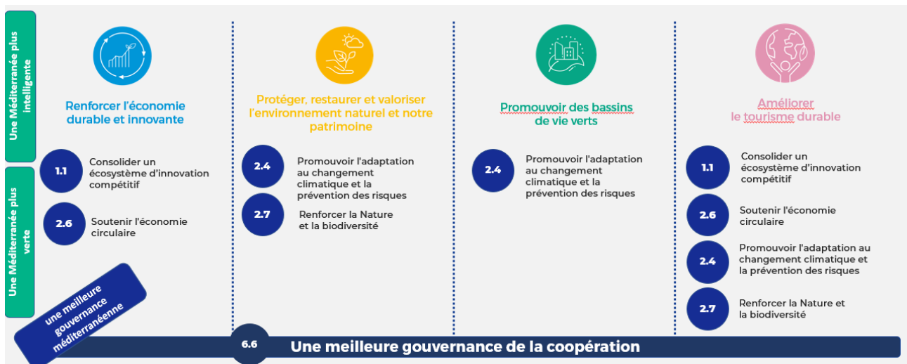
Illustration de la structure du Programme et des types de projets : priorités, objectifs spécifiques et missions

Tous les projets thématiques opérant sous chaque mission sont soutenus par un projet de communauté thématique et un projet de dialogue institutionnel.