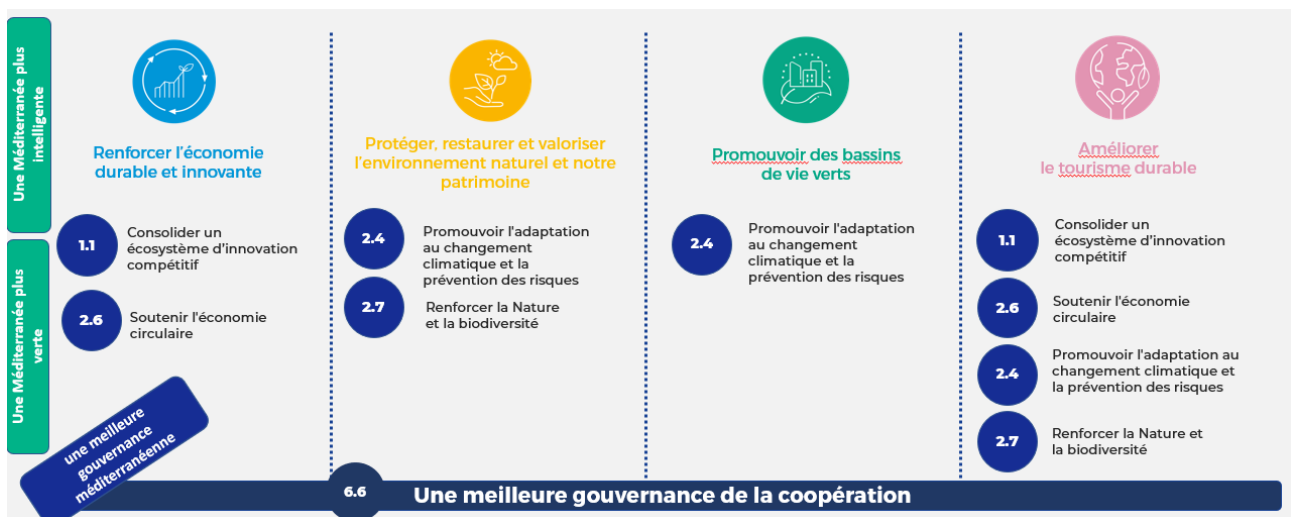
Illustration de la structure du Programme et des types de projets : priorités, objectifs spécifiques et missions

Tous les projets thématiques opérant sous chaque mission sont soutenus par un projet de communauté thématique et un projet de dialogue institutionnel.